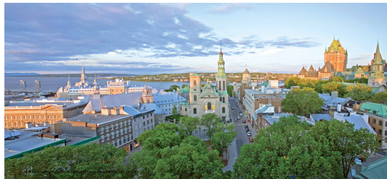
Vue panoramique du Vieux-Québec / Panoramic view of Old Québec.