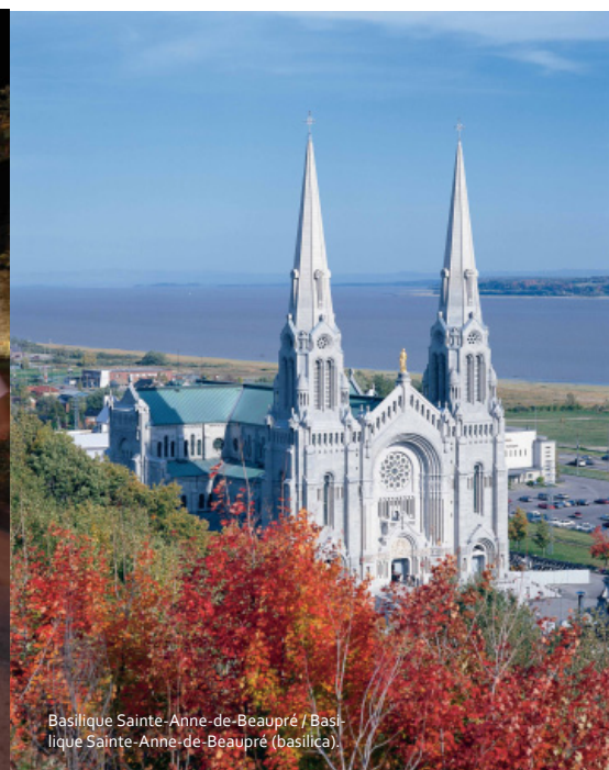
Basilique Sainte-Anne-de-Beaupré / Basilique Sainte-Anne-de-Beaupré (basilica).